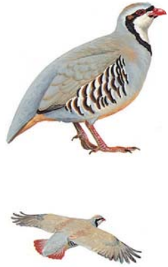
الحجل Chukar Partridge Alectoris chukar

المواصفات: طائر متوسط الحجم، يعيش على الأرض في الأراضي الصخرية الجبلية. رمادي وأسود من الأعلى. الجوانب بيضاء وكستنائية مخططة، والوجه أبيض محاط بطوق أسود. ويعرف بصوته المميز. التوقيت: الحجل طائر مقيم غير مهاجر. الوضع: غير مهدد.