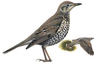
سُمَّة الدبق Mistle Thrush Turdus viscivorus

الطعام: تأكل انواع التوت البري والزيتون والفاكهة والبزاق والديدان.