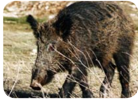
٣،٢ تمييز طرائد الصيد من الحيوانات

المواصفات: طائر متوسط الحجم، يعيش على الأرض في الأراضي الصخرية الجبلية. رمادي وأسود من الأعلى. الجوانب بيضاء وكستنائية مخططة، والوجه أبيض محاط بطوق أسود. ويعرف بصوته المميز. التوقيت: الحجل طائر مقيم غير مهاجر. الوضع: غير مهدد.