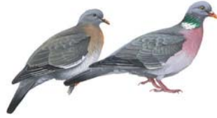
حمام الغابات (الدلم) Woodpigeon Columba palumbus

الوضع: غير مهدد. الطعام: يأكل الحبوب والبذور