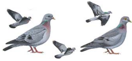
الحمام البري Stock Dove Columba oenas

المواصفات: يألف الحمام الجبلي الجبال والوديان الصخرية. بينما يتواجد الحمام