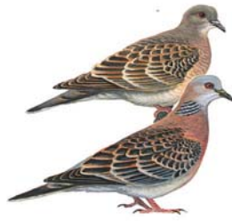
الترغل Turtle Dove Streptopelia turtur

المواصفات: بمامة متوسطة الحجم سريعة الطيران. تُعرف من أسفل الأجنحة الداكنة. ورقعة البطن البيضاء والأجزاء العليا الضاربة إلى الحمرة المنقطة بالأسود. بالإضافة إلى البقعة الرمادية المزرققة على الجزء الخارجي من الجناح والرقعة المرقعة على الرقبة. التوقيت: مصيف معشش: يعيش في لبنان بعد أن يأتي من الخارج الجنوبي بين منتصف نيسان ومنتصف آب. ويغادر مع أول أيلول جنوباً للإشتاء. ذروة العبور في أيلول. الوضع: غير مهدد. الطعام: يأكل الحبوب والبذور والأعشاب الضارة