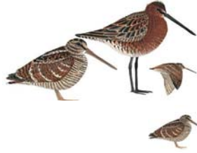
ديك الغاب أو دجاجة الأرض Woodcock Scolopax rusticola

المواصفات: محصور تقريباً في الأحرش والغابات. عندما يُشاهد على الأرض.