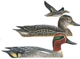
الحذف الشتوي Teal Anas crecca

المواصفات: بطة مائية كبيرة. يتم التعرف على الذكر بسهولة من لون الرأس الأخضر القاتم، والمنقار الأصفر، والصدر البني، والجسم الرمادي. الأنثى بنية منقطة مثل إناث البط الأخرى وتتميز عن معظم الأنواع الأخرى بحجم الجسم، وشكل ولون المنقار، ونمط الجناح. التوقيت: يفرخ البط الخضاري بشكل غير منتظم في عميق حيث يحظى بالحماية. ينتشر بأعداد وفيرة طيلة فترة الصيد من أول أيلول وحتى آخر كانون الثاني. الوضع: غير مهدد الطعام: يأكل حبوب ونبات وأصداف وحشرات وتوت بري وبلوط.