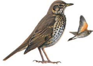
السمن المغرد Song Thrush Turdus philomelos

الوضع: غير مهدد هذه السنة حسب الدراسات العلمية الطعام: يأكل الحبوب