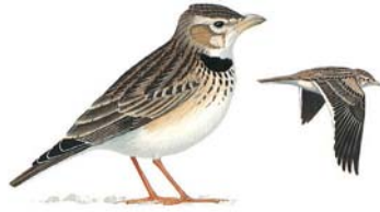
المطوق Calandra Lark Melanocorypha calandra

المواصفات: بمامة متوسطة الحجم سريعة الطيران. تُعرف من أسفل الأجنحة الداكنة. ورقعة البطن البيضاء والأجزاء العليا الضاربة إلى الحمرة المنقطة بالأسود. بالإضافة إلى البقعة الرمادية المزرققة على الجزء الخارجي من الجناح والرقعة المرقعة على الرقبة. التوقيت: مصيف معشش: يعيش في لبنان بعد أن يأتي من الخارج الجنوبي بين منتصف نيسان ومنتصف آب. ويغادر مع أول أيلول جنوباً للإشتاء. ذروة العبور في أيلول. الوضع: غير مهدد. الطعام: يأكل الحبوب والبذور والأعشاب الضارة