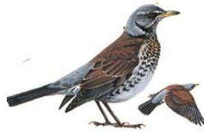
الكيخن أو سمنة الحقول Field Fare Turdus pilaris

التوقيت: يفرخ الحذف الصيفي بشكل غير منتظم في عميق حيث يحظى بالحماية. ينتشر بأعداد وفيرة منذ بداية أيلول حتى أوائل تشرين الثاني. الوضع: غير مهدد هذه السنة حسب الدراسات العلمية. الطعام: يأكل حبوب ونبات وأصداف وحشرات وتوت بري وبلوط.